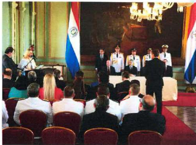
Acto de Juramento de Juan Manuel Brunetti ante el Poder Ejecutivo como embajador ante la República Oriental de Uruguay

La Escribanía Mayor de Gobierno se encuentra al día en las gestiones y procesos de servicios solicitados; retrasos que pudieran darse dependen de la no presentación de documentos requeridos por otras instituciones que intervienen en el proceso de regularización y ordenamiento de los títulos de bienes del Estado (por parte de las Instituciones solicitantes) o de los plazos mínimos y máximos de que disponen otras instituciones para el procesamiento de los trámites requeridos.-