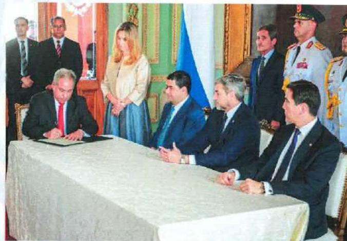
Acto de Juramento de Rodolfo Segovia Colmán, nombrado por Decreto Nº 7634 como Ministro Interino en agosto pasado y posteriormente confirmado en el cargo por Decreto Nº 8923 del Poder Ejecutivo.