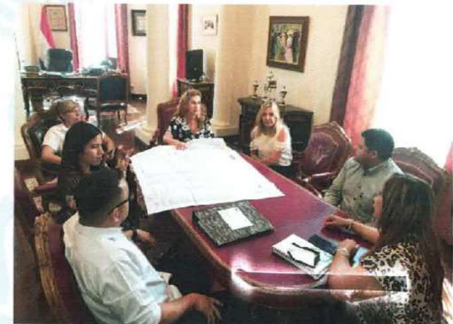
Mesa de trabajo interinstitucional con el INDERT sobre el Barrio Santa Lucía – Distrito de Itakyry – Dpto. de Alto Paraná